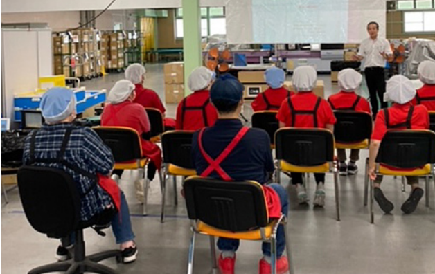
アイセン社内教育訓練の様子