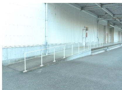
車いすの方も出入りしやすいスロープ