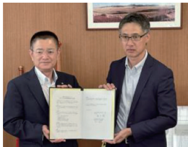
【上富田町との協定式】

上富田町とまちづくりに係る包括的地域連携協定を2023年6月5日に締結いたしました。