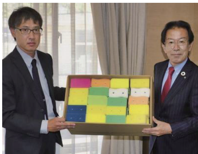
【白浜町への寄贈式】

製造過程で出た規格外で販売できないスポンジ約千個を白浜町に寄贈しました。スポンジは学校や福祉施設、公民館などにて活用されるとのことです。